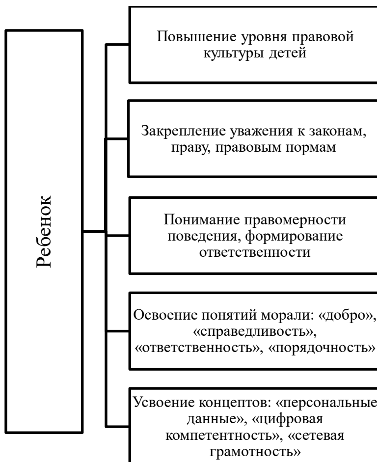
Рисунок 2. Правовое воспитание детей Figure 2. Legal education of children

Основные элементы правового воспитания детей представлены на рисунке 2.