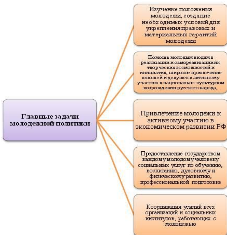
Рисунок 1. Цели молодежной политики

В самом генезисе молодежная политика оказалась структурированной в регионально-политические отношения и муниципальные органы власти. Они осуществляют молодежную политику, цели которой представлены на рисунке 1.