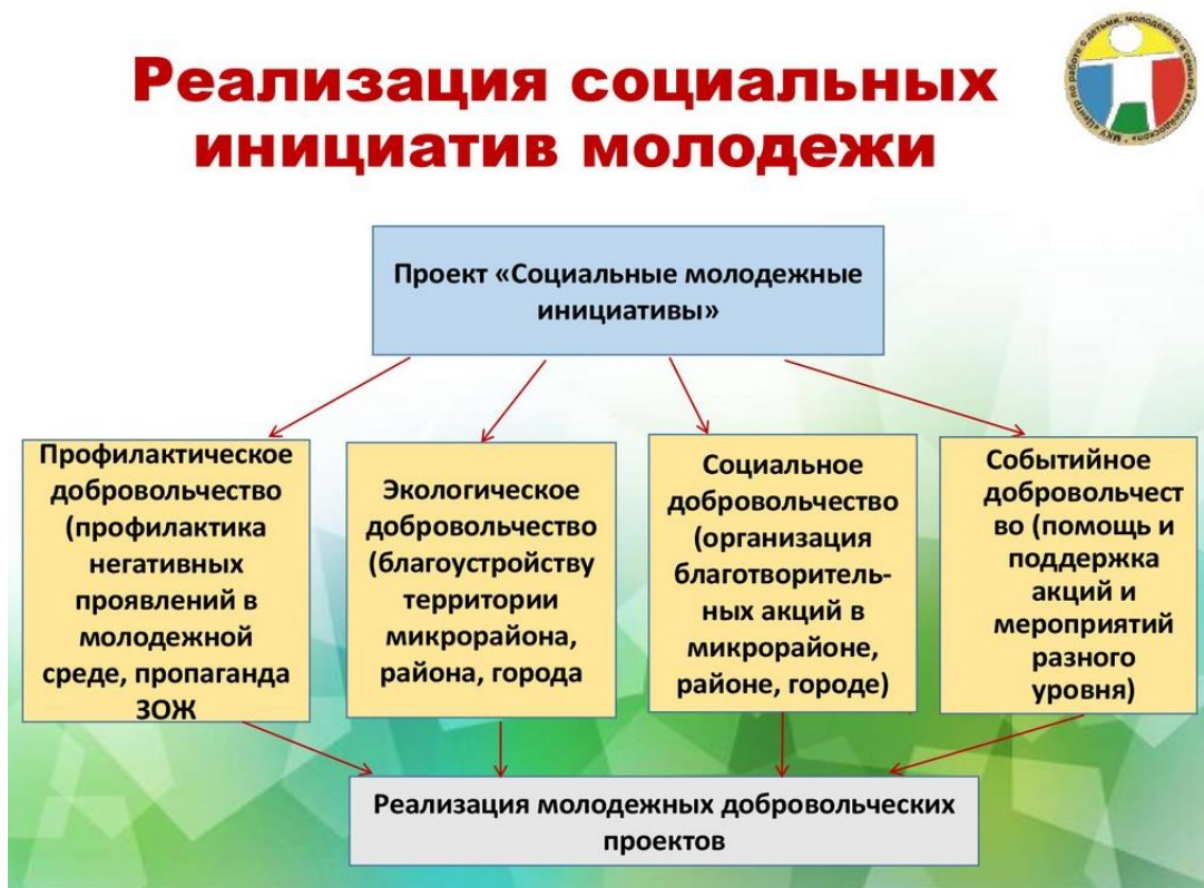
Рисунок 2. Реализация социальных проектов молодежи в РСО-А

бытийное), имеющие свои направления деятельности (рисунок 2). В условиях пандемии этот проект оказался наиболее значимым и показал свою состоятельность.