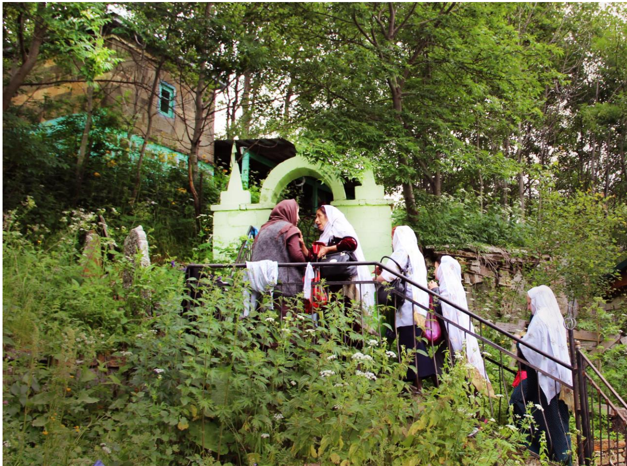
Зиярат в с. Шири Дахадаевского района.

Святылище состоит из двух помещений, располагающихся одно над другим. В нижнем находится, собственно, само захоронение шейха. Над ним маленькое помещение (вход находится с задней стороны святылища), застланное коврами. Здесь собираются небольшими группами (отдельно мужчины или женщины) и проводят моления в день совершения паломничества (см. фото).