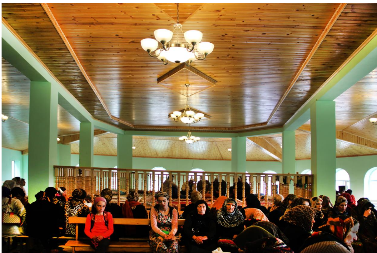
Внутреннее устройство помещения.

У стен помещения специально продуманы места для разделки мяса жертвенных животных.