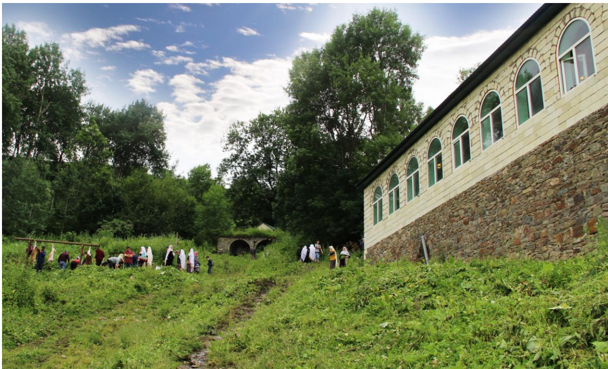
Помещение для совершения ритуалов, построенное на пожертвования паломников

В селении Шири усилиями городских выходцев создаются условия для удобства паломников. На пожертвования верующих реставрируется и облагораживается место зиярата. В 2010-2014 гг. в центре села, рядом с зияратом, построено одноэтажное здание. Просторное, с большим количеством окон, оно продумано для исполнения религиозных обрядов. (см. фото)