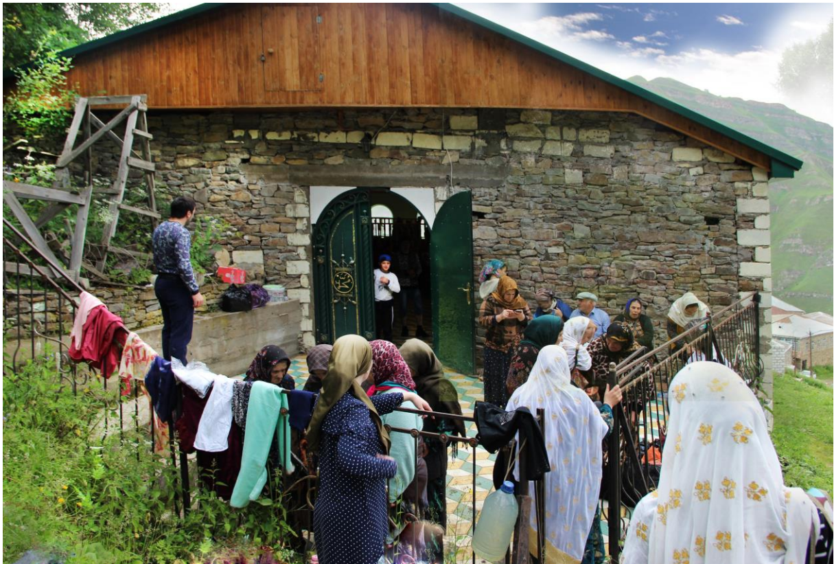
Паломницы около входа помещения для совершения ритуалов

Также полевые материалы показали, что в ритуальных составляющих паломничества в Шири произошли отдельные изменения. По словам информанта 1 , в 60-80 годы XX в. круговой обход вокруг зиярата шейха Хасана являлся одним из действий обряда паломничества, но со временем верующие стали отказываться от него. Интересно, например, что в лезгинском с. Хрюг на святилище местного суфия есть надпись, специально оговаривающая обрядовое назначение зиярата, «чтобы обходить [это место] вокруг со [всех] сторон» [13, с. 316].