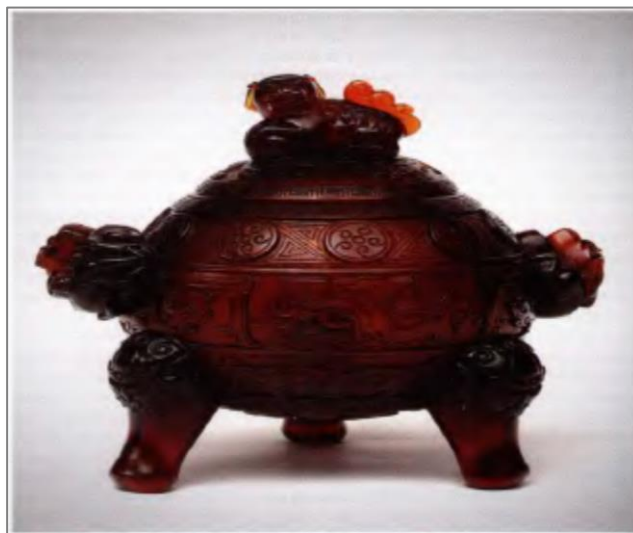
Рис. 2. Сосуд с крышкой (конец XIX в.) Fig. 2. Vessel with a lid (late 19th century)

В XIX веке китайские стеклорезы более широко используют приемы западных мастеров, использовавших стекло чистых, звучных тонов, которое в завершенном виде ассоциируется с драгоценными камнями – сапфиром, рубином или изумрудом [9, с. 74]. В XX столетии происходит обогащение новыми элементами за счет внедрения в произведения китайских стеклодувов декоративных элементов европейского стиля Арт Нуво , с его неожиданными композиционными решениями, некоторой причудливостью и одновременно изысканностью форм и рельефного рисунка [9, с. 74] (рис. 2).