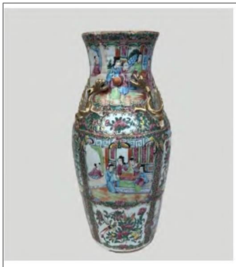
Рис. 1. Ваза для цветов стиля «Розовое семейство» (XIX в.) Fig. 1. Flower vase in the Rose Family style (19th century)

В этот период времени китайские мастера совершенствуют и саму фарфоровую массу, добиваясь безупречного отбеливания фарфоровой поверхности, на которой при нанесении краски еще более контрастно проступает роспись в новой гамме цветов – чаще всего с преобладанием нежных, розовых, оттенков. Так создается роскошный декоративный стиль, вызванный «европеизацией» вкусов китайской знати и, главное, императорского двора, соответствующий общей атмосфере роскоши придворной жизни правящей династии [7].