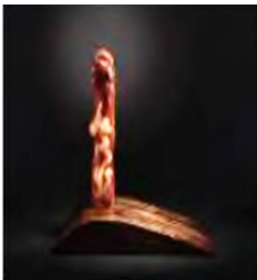
Рис. 4. Хэ Ма. «Метаморфозы» (2009 г.)

Рассмотрим одну из лучших работ Хэ Ма. Она называется «Метаморфоза» (рис. 4). Основой для работы послужил шоушаньский розовый кварц. Этот камень в основном красного цвета, но с вкраплениями белого. Автор использовал естественную окраску камня для своего замысла, вырезав основную красную часть в форме плавящейся свечи, тогда как белая часть была вырезана в форме абстрактного женского тела.