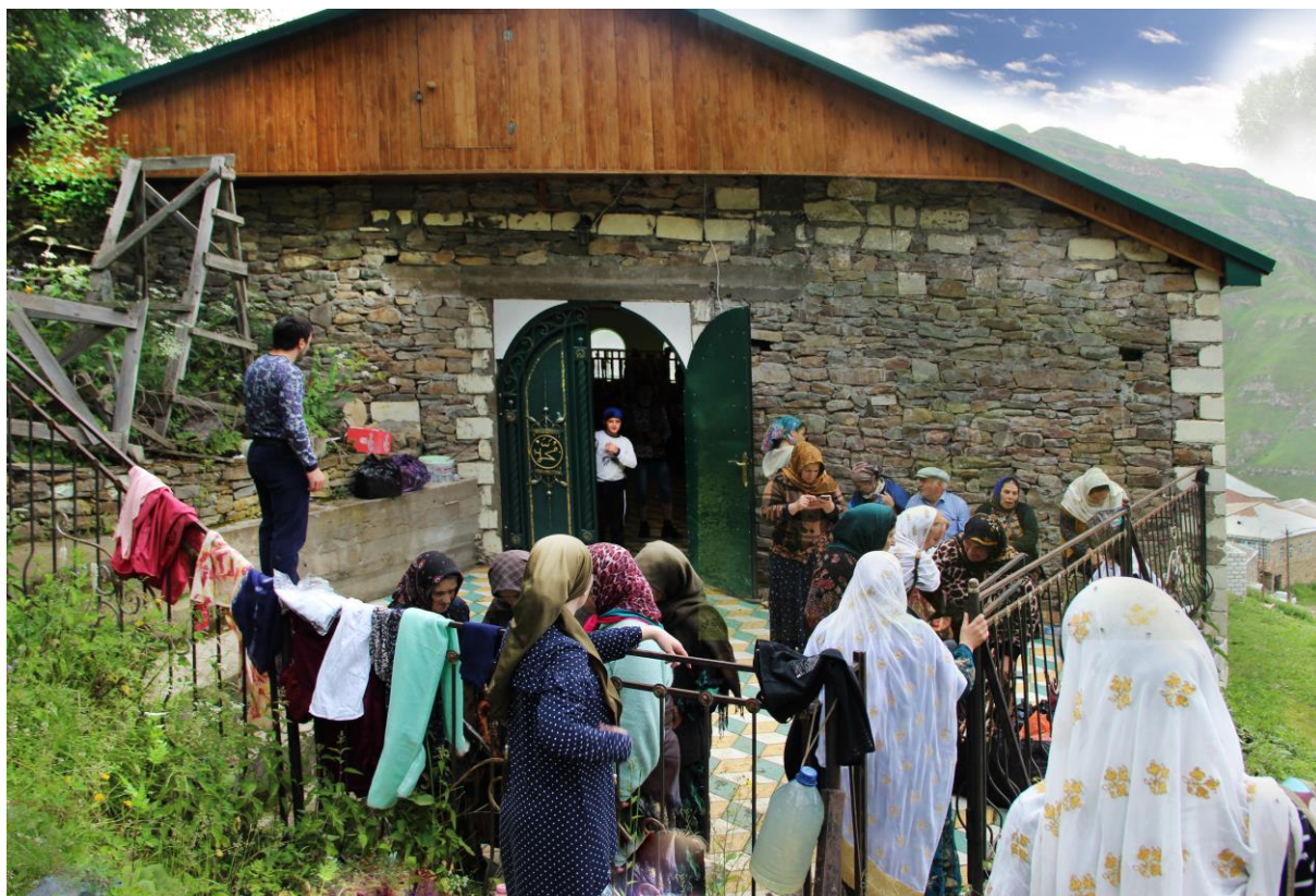
Паломницы около входа помещения для совершения ритуалов

Также полевые материалы показали, что в ритуальных составляющих паломничества в Шири произошли отдельные изменения. По словам информанта 1 , в 60-80 годы XX в. круговой обход вокруг зиярата шейха Хасана являлся одним из действий обряда паломничества, но со временем верующие стали отказываться от него. Интересно, например, что в лезгинском с. Хрюг на святилище местного суфия есть надпись, специально оговаривающая обрядовое назначение зиярата, «чтобы обходить [это место] вокруг со [всех] сторон» [13, с. 316].