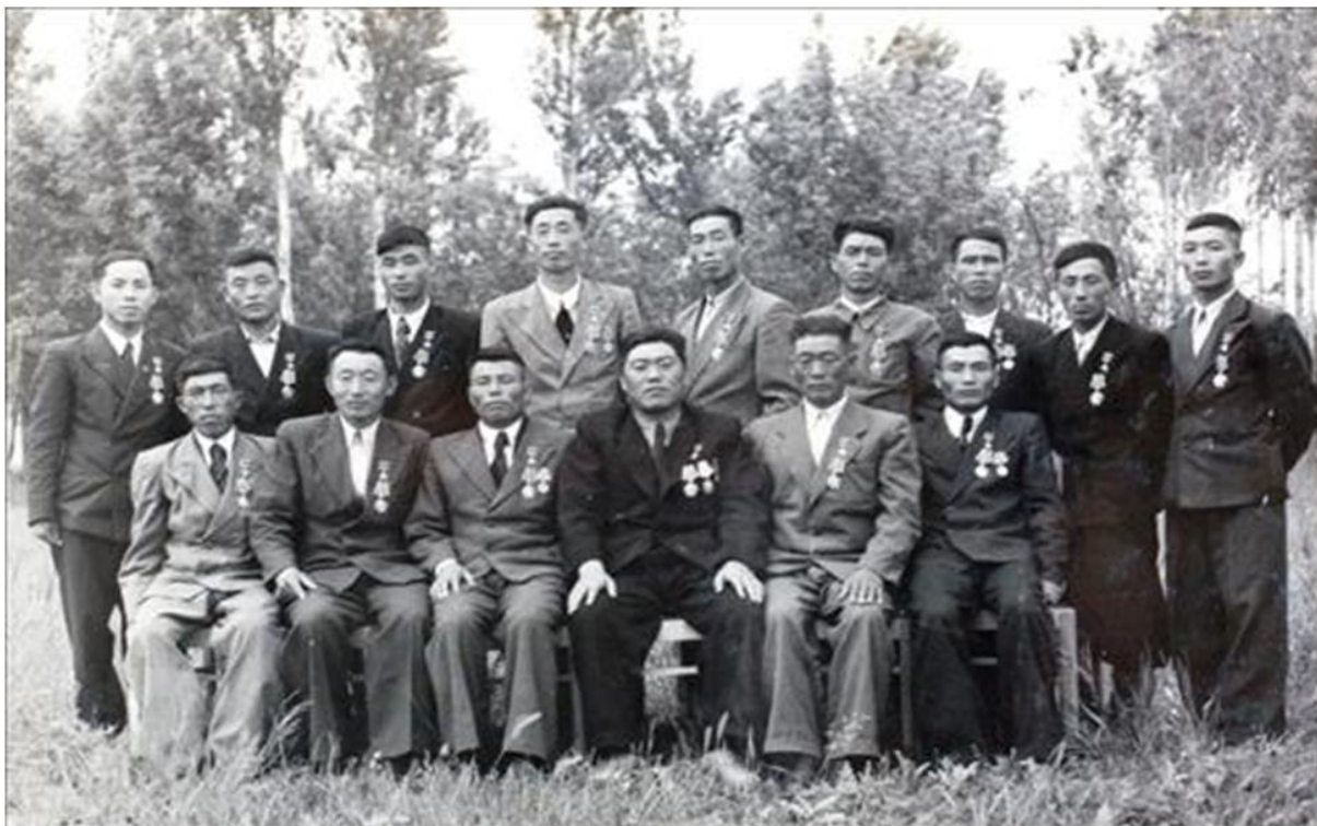
Трудовые победы тружеников колхоза им. Я. Свердлова. Узбекская ССР Labor victories of the workers of the collective farm. Ya. Sverdlov. Uzbek SSR

Пример Героев всегда был убедительным, но награда исторически была учреждена только в 1938 г. Звание Героя Социалистического Труда было наделено статусом высшей трудовой награды за особо выдающуюся новаторскую деятельность в области промышленного производства, в аграрной сфере, в торговле и в области научных открытий.