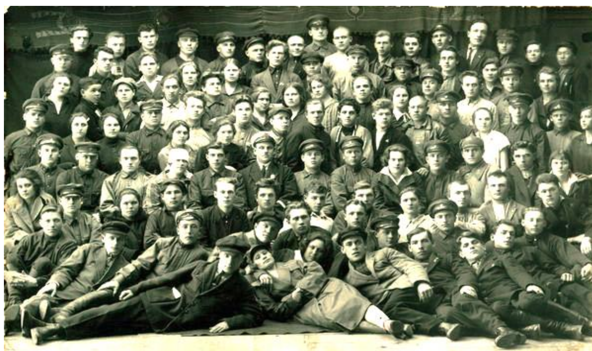
Советские люди Советской страны