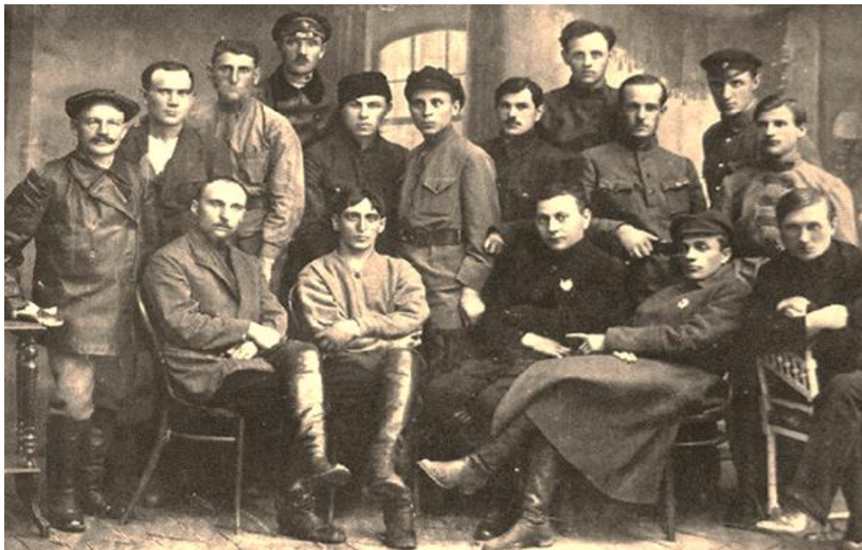
Советские люди. Сотрудники НКВД

Введение. Русские как этническая общность формировались в сложной социально-культурной и природной среде. Подлинная история России с выстраданными ее народами историческими уроками чрезвычайно поучительна. Дело в том, что в условиях современных мировых цивилизационных вызовов остро требуется объективное историческое знание. Оно весьма полезно, в первую очередь для государственных структур при реализации политики национальной памяти как важнейшей составляющей духовного бытия русского народа. Русский народ, несмотря на тяжелейшие лишения, тысячелетиями жертвовал жизнями, создавая государство и организуя в нем жизнь. В своей повседневности русские противостояли демагогам от власти, преодолевали смуты, распри, разного рода притязания, теряя из своей среды значительную часть трудоспособных людей и исконной территории.