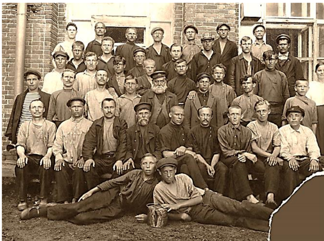
1920-е годы. Рабочие Советской страны

Русские составляли абсолютное большинство населения и в европейской, и в азиатской части самой большой республики СССР – Российской Федерации.