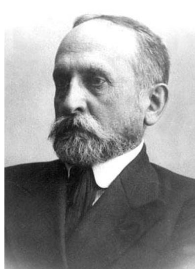
Рис. 3. С.Ф. Ольденбург

По штатному расписанию, утвержденному Александром III, с 1 января 1894 г. предусматривалось следующее ежегодное жалование ученым: ординарному академику – 4200 рублей (в том числе жалование – 2400, квартирные – 600, за звание – 1200); экстраординарному академику – 3000 рублей (в том числе жалование – 1500, квартирные – 500, за звание – 1000) [4].