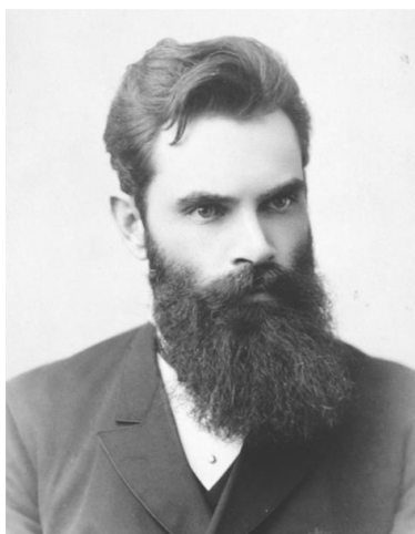
Рис. 8. А.М. Ляпунов