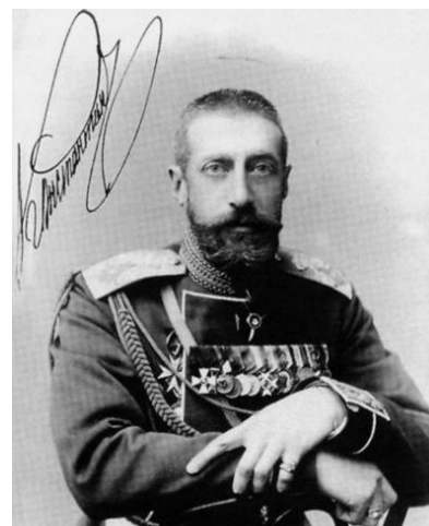
Рис. 9. Президент академии К.К. Романов