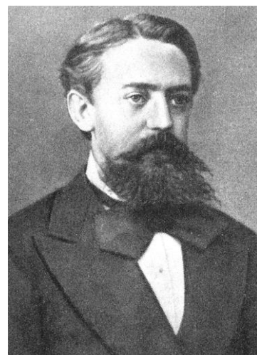
Рис. 6. А.А. Марков