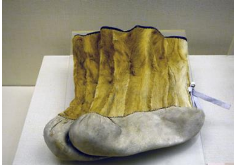
Рисунок 5. Сапоги народа орочон из меха косули династии Цин