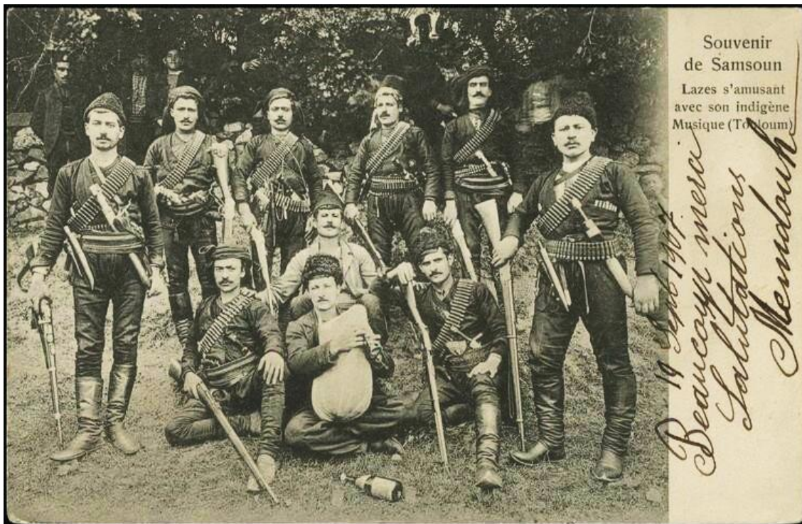
Военный отряд лазов, Батуми, 1919 г. Laz military detachment, Batumi, 1919

Лазы относятся к этническому меньшинству Союза ССР, в частности Грузии. Тем не менее, некоторые их представители, начиная с 1918 г., проживали и вне границ Грузии (кроме Турции).