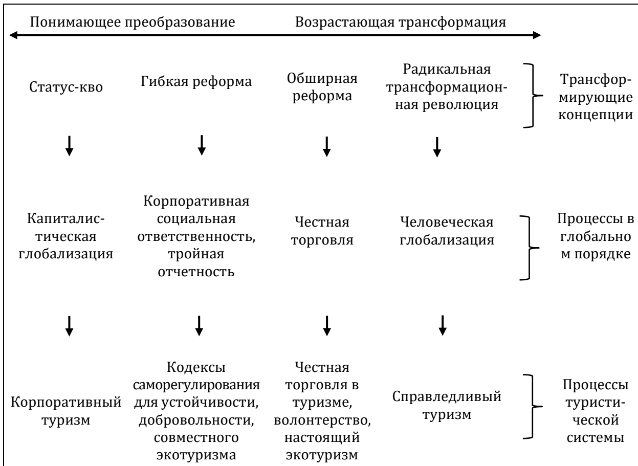
Рисунок 2. Возможные непрерывные трансформации в институте туризма Figure 2. Possible continuous transformations in the tourism institute