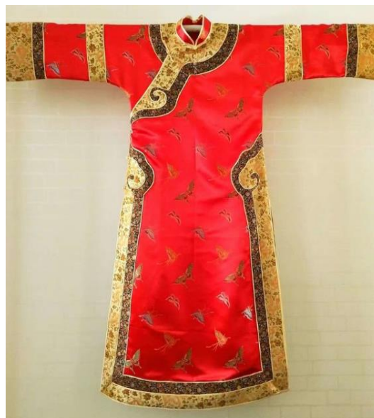
Рисунок 3. Маньчжурский женский ципао