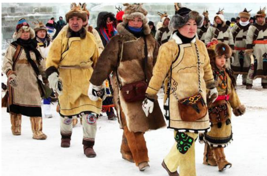
Рисунок 2. Одежда народности орочон

Одежда орочонов в основном изготавливается из меха животных. В процессе разработки модели одежды получилась меховая двубортная верхняя одежда с довольно широкими рукавами. Как у мужчин, так и у женщин используются украшения из меха на воротнике и по краю одежды для пущей декоративности. В длинном халате используется длинный пояс, подчеркивающий талию; он заметно стройнит, но при этом дает чувство удобства и комфорта при физическом труде и в повседневной жизни. По сравнению с другими малыми народностями одежда орочонов наиболее самобытна, как показывает рисунок 2.