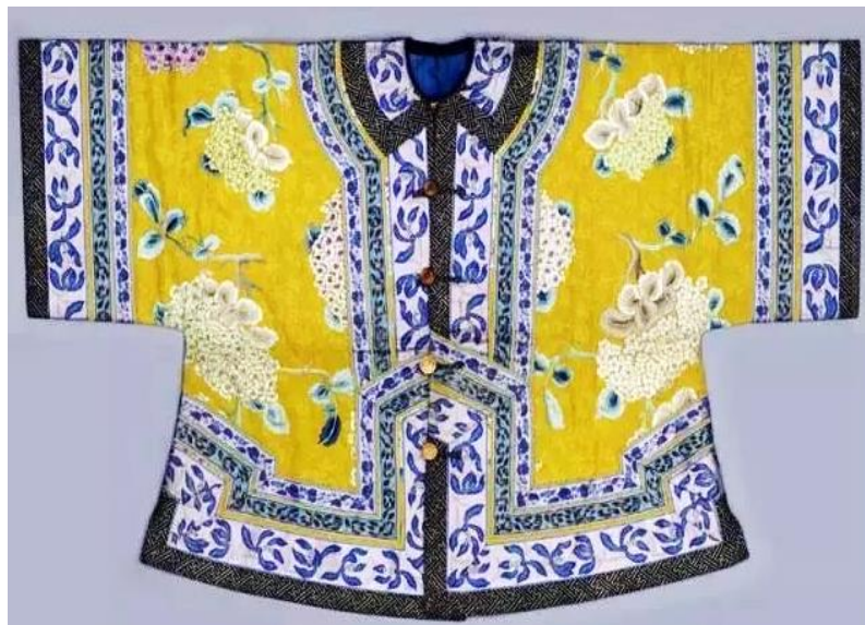
Рисунок 1. Маньчжурская магуа

Короткая плечевая одежда, распространенная у малых народностей Китая, обладает высокой степенью практичности. Существует довольно много видов короткой плечевой одежды, таких как магуа (куртка, надеваемая поверх халата), жилет, меховой парадный костюм и т.д. Она отлично подходит для людей низкого роста, отвечая при этом их потребностям. Структура короткой плечевой одежды сравнительно уникальна: от плеча до рукава представляет собой прямую линию, манжет и подол дугообразны, воротник закруглен, имеет оторочку на манжетах и подоле, при изготовлении используется цветной шелк. Все это еще значительно подчеркивает женскую красоту. Среди маньчжурской короткой плечевой одежды распространена, например, магуа (куртка), название которой происходит от мужчин-наездников. Длина такой куртки сравнительно коротка, однако на талии со обеих сторон присутствуют разрезы. Как правило, она надевается поверх длинного халата и служит защитой от различных неблагоприятных факторов [1]. Форма такой куртки в общем-то уникальна: она двубортная, с запахом, запаховывается на уровне шеи. Со временем она постепенно изменялась: так появился уникальный двубортный высокий ворот, также возникли разрезы, рукав стал более коротким для удобства надевания на длинный халат. Эта форма одежды как у мужчин, так и у женщин все еще использовалась для официальных мероприятий во времена Китайской Республики (1912–1949 гг.). На рисунке 1 представлена такая магуа (куртка).