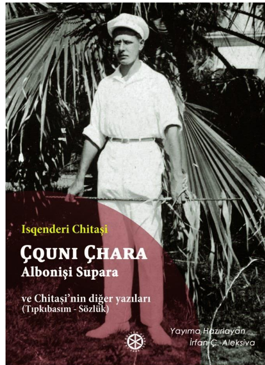
Рис: 1920-е годы. Искандер Т. Циташи (Циташвили), общественный деятель 1920s. Iskander T. Tshitashi (Tshitashvili), public figure

Обращение способствовало тому, что Правительство Грузии обязано было заняться проблемой обустройства лазов. В этом же году руководство КП(б) Грузии пригласило И. Циташи на заседание бюро. Решением КП(б) Грузинской ССР была создана Комиссия по изучению положения лазов. И. Циташи обращался кон-