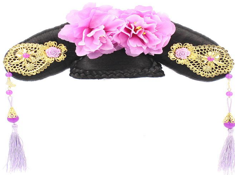
Рисунок 4. Маньчжурская цидоу

В Маньчжурии, например, головные украшения женщин более своеобразны и демонстрируют явные особенности. Наиболее уникальной является «цидоу», которая была очень популярная при династии Цин. Ее носили маньчжурские аристократки, надевая на крупные празднества [7]. Цидоу обычно состоит из проволочного каркаса, обмотанного черным лазурным атласом, который формирует веерообразную форму. Для крепкой фиксации основание сделано пустым, а середина украшена в определенном порядке большими цветами. Также она декорирована различными подвесками и жемчугом. Обычно по краям используются длинные кисточки, чтобы продемонстрировать грацию, изящество женщины. При ходьбе длинные кисточки и подвески раскачивались, тем самым раскрывая темперамент и эстетичность своей обладательницы. На рисунке 4 изображена маньчжурская цидоу.