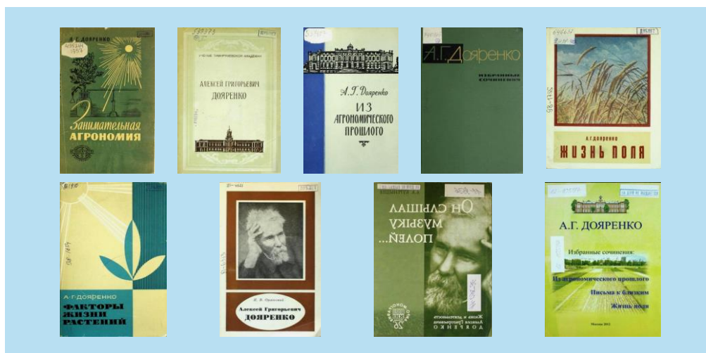
Рисунок 1. Примеры книг А.Г. Дояренко Figure 1. Examples of books by A.G. Doyarenko

В 1929 г. А.Г. Дояренко за участие в деятельности Трудовой крестьянской партии был арестован и получил пять лет тюрьмы и три года ссылки. В тюрьме ему удалось написать книги, вошедшие в классику аграрной науки: «Курс общего земледелия», «Курс опытного дела», «Занимательную агрономию», «Жизнь поля» (2-е издание) и множество статей.