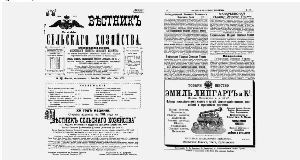
Рисунок 2. Титульная страница журнала Figure 2. The title page of the magazine

Его талант организатора и общественного деятеля особенно был успешным на поприще издательской деятельности. В 1900 г. Московское общество сельского хозяйства начало издавать новый журнал «Вестник сельского хозяйства» (рис. 2).